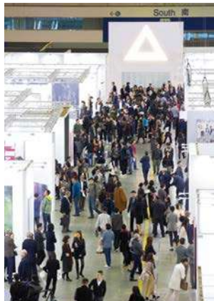
首屆《台北當代藝術博覽會》展況