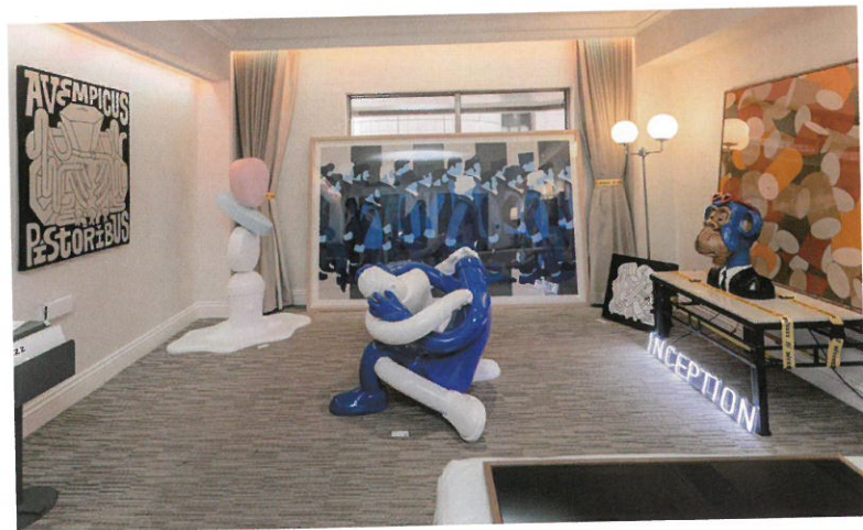
ONE ART Taipei 2022

「首先，ONE ART Taipei明年的地點改了。因為原來合作的西華飯店已經休業，我們在仔細深思之後，決定選擇新的活動地點是位於台北市南京東路上的JR東日本大飯店台北，這是第一點。第二點，我們配合新的活動地點既定的設施，選擇了12層至15層來作為承載70家國內