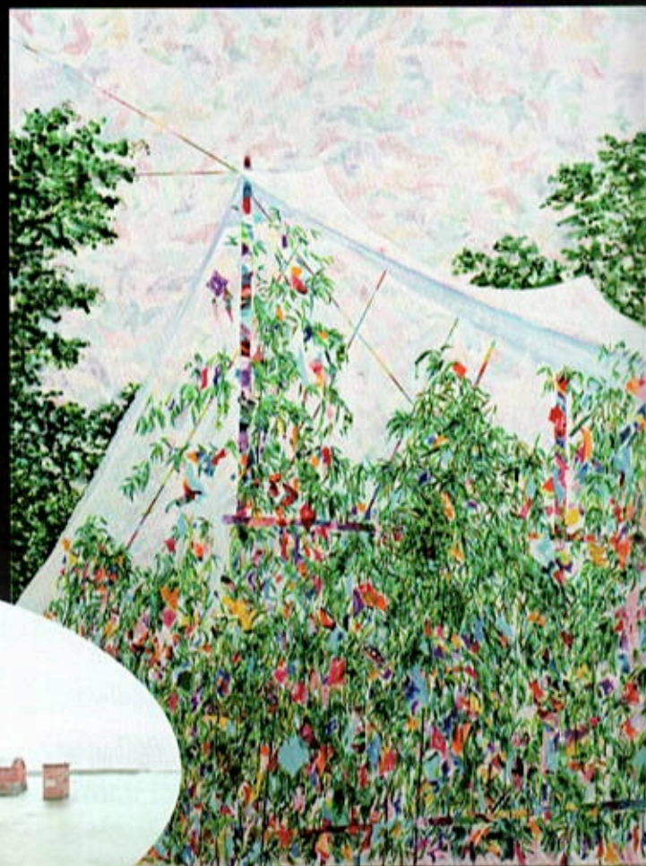
也趣藝廊：曾麟媛《得以相見》 150 x 112 cm，壓克力 & 布，2021。