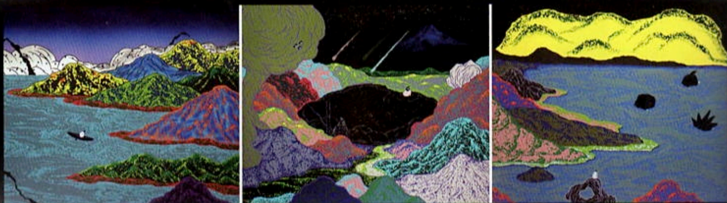
琢璞藝術中心 J.P. ART CENTER：張騰遠 《日遊夜遊》60.5x70x3cm，壓克力畫布，2018。

第四屆「ONE ART Taipei 2022 藝術台北」將於 2022 年 1 月 14 日至 16 日在台北西華飯店盛大展開。雖然經歷疫情動盪，參展畫廊數量仍再創高峰，匯集全台及海外 70 間展間，逾 55 家國內外畫廊參與響應，其中十餘家更分別是海外與首次參與的新興畫廊。本屆將沿襲三大主題展區「藝術無限 (Unlimited)」、「發現藝術 (Discovery)」以及「媒體藝術 (Media Art)」，最受矚目之兩大獎項「新賞獎 (ONE ART Award)」、「最佳空間呈現獎 (Best Interior Design Award)」。