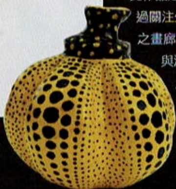
朝代畫廊 Dynasty Gallery：草間彌生《無題》10.5x10.5x10.5cm，綜合材料，1985。