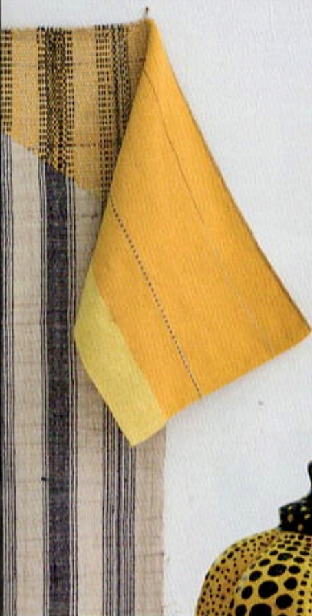
東之畫廊 East Gallery：鄭安利《Graftage Detail 01》 172 x 35 x 45cm，現成物，烏干紗、棉、羊毛，2017。