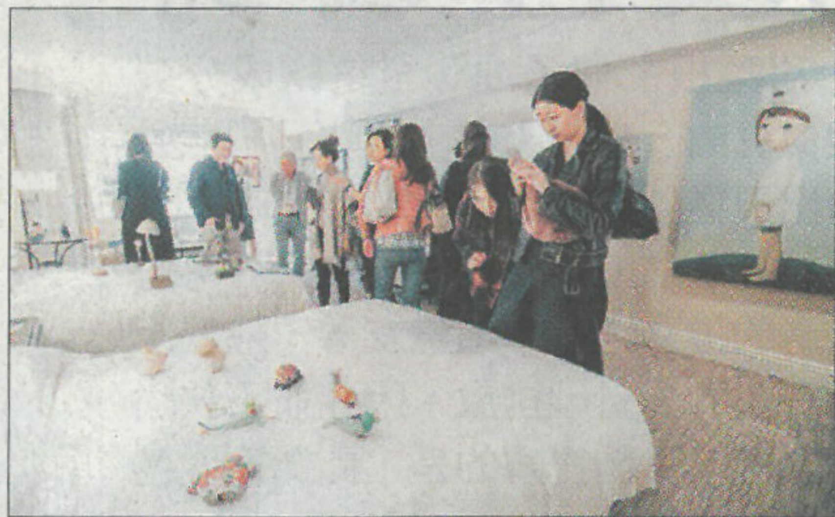
以舒適、精緻走向的飯店型藝術博覽會「ONE ART Taipei 2020 藝術台北」，將於明年1月17至19日登場。

除了OAT，明年1月亦有「Taipei Dangdai 台北當代藝術博覽會」與「ART FUTURE 藝術未來」兩個展會同時舉行，對此劉忠河表示樂觀其成，更認為共襄盛舉才能吸引國際藏家來台，在良性競爭之下只會更好，雖然OAT定位在飯店型，卻也五臟俱全。